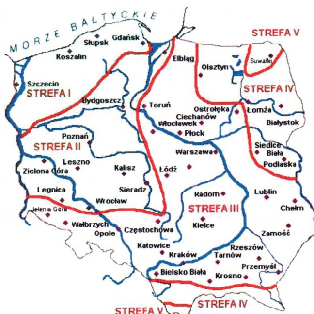
Rys. 1 Strefy klimatyczne Polski i temperatury obliczeniowe

Położenie obiektu, w którym planowany jest montaż, na mapie ma wpływ na pracę instalacji. W zależności od współrzędnych geograficznych rozbieżności w temperaturach projektowych mogą mieć znaczącą wartość. W skali kraju ilustruje to poniższa mapa (Rys.1).